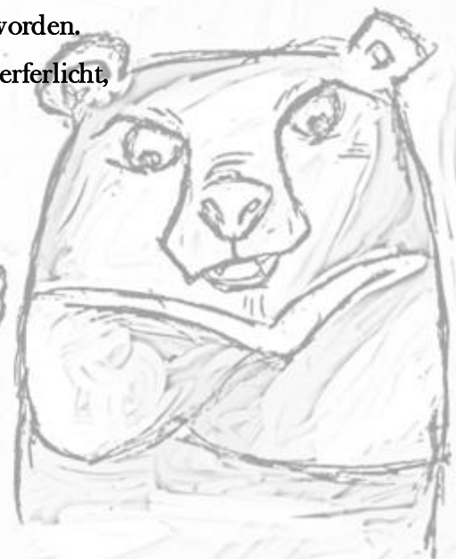
Illustration Sketch by Rebeca M. Neves